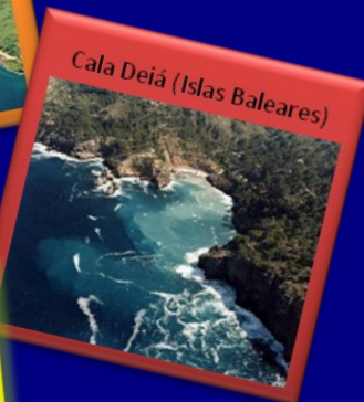
Cala Deiá (Islas Baleares)