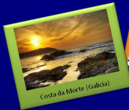
Costa da Morte (Galicia)

Propuestas para la gestión de las costas españolas