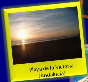
Playa de la Victoria (Andalucía)