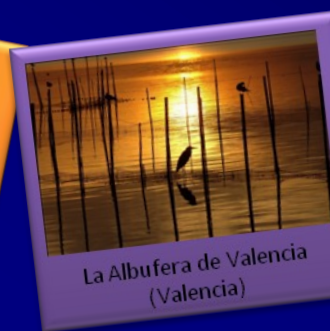
La Albufera de Valencia (Valencia)