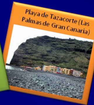
Playa de Tzacorte (Las Palmas de Gran Canaria)