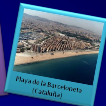
Playa de la Barceloneta (Cataluña)