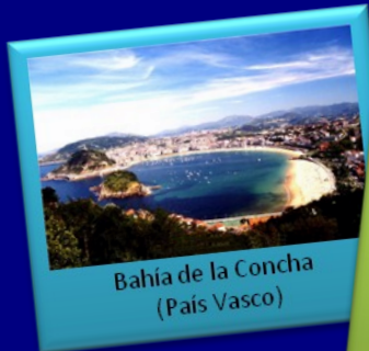
Bahía de la Concha (País Vasco)

gestioncostera.regial@uca.es www.gestioncostera.es