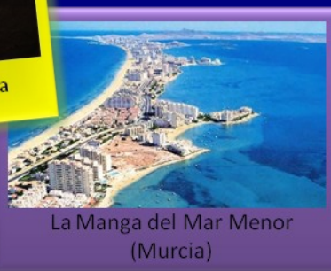
La Manga del Mar Menor (Murcia)