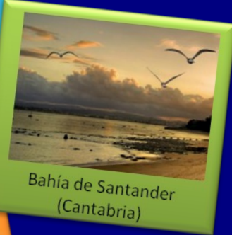
Bahía de Santander (Cantabria)