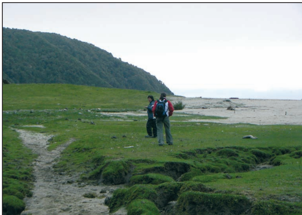
Playa de Caleta Cóndor, Chile (C. Castro)