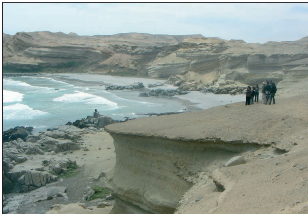
Sector Aguda de Chorrillo del Área Marina y Costera Protegida de Múltiples Usos Isla Grande de Atacama, Chile (C. Castro)