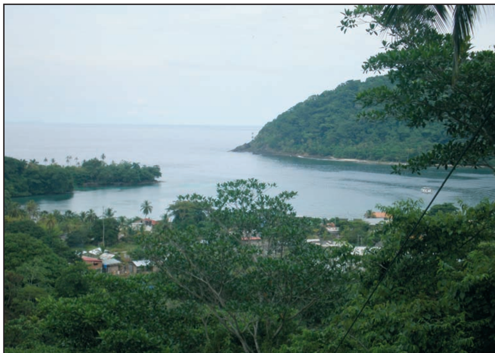
Bahía de Sapzurro, Golfo de Urabá, Caribe colombiano ( INVEMAR, Colombia )