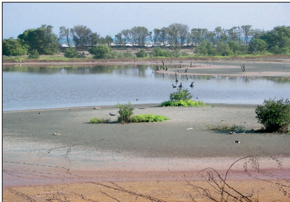
Playón litoral en el área protegida Vía Parque Isla de Salamanca , Ciénaga Grande de Santa Marta, Caribe colombiano ( Universidad de Magdalena, Colombia )