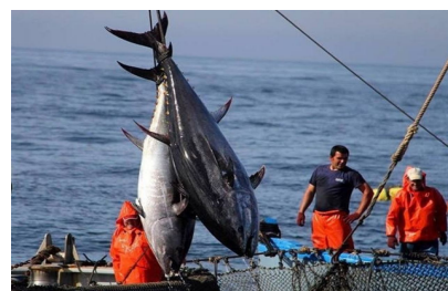
Pesca de atún rojo, 2016

Además, reclama que las autoridades realicen un control más exhaustivo sobre el origen