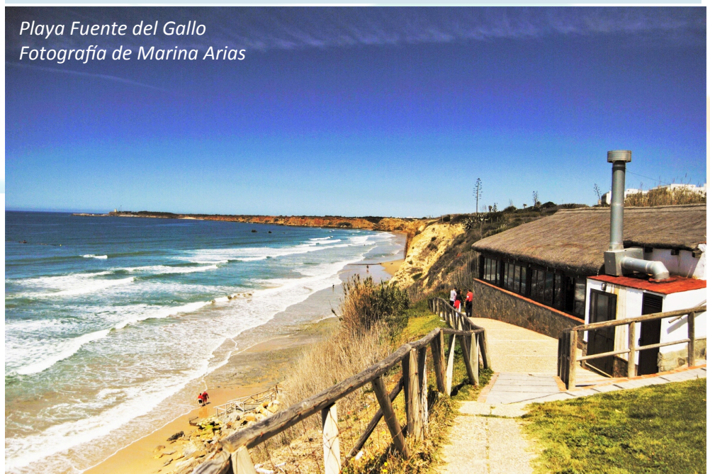
Playa Fuente del Gallo

Elaborado por los alumnos del Máster de Gestión Integrada de Áreas Litorales.