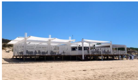
Ejemplo de la elevación de un chiringuito de playa en Chiclana de la Frontera.

Estas son algunas de las razones que llevaron a la elevación de los chiringuitos de las playas de Chiclana, un ejemplo de buenas prácticas que sin duda nos muestra la concienciación de la administración en una necesaria Gestión Integrada de nuestras áreas litorales.