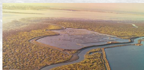
Salina La Covacha.