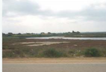
Panorámica del DPMT