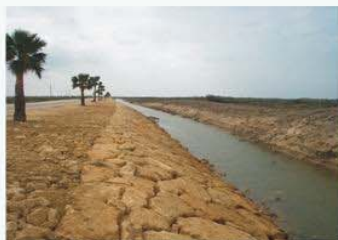
DPMT - Caño encauzado entre la carretera y la playa