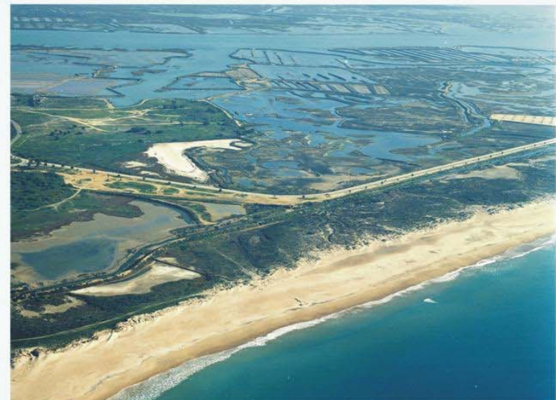
Fotografía oblicua del tramo, con la playa de Camposoto, la salina de Santa Leocadia, el caño y las marismas de Sancti-Petri al fondo.