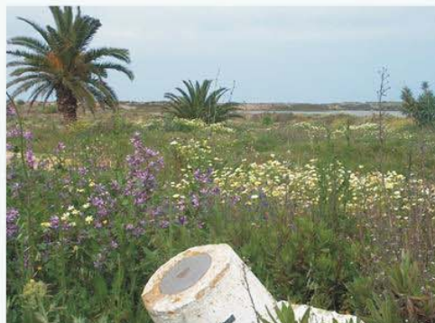
ZSP- Hito de deslinde, hasta el cuál llega el DPMT