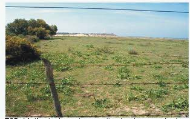
ZSP- Vallada legal y pastizal sobre sustrato arenoso