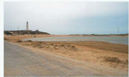
DPMT- Vista de la laguna mareal desde la carretera de acceso al faro