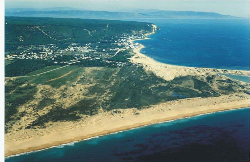
Fotografía oblicua del tramo en el que se aprecian el arenal costero, el tómbolo doble y las lagunas litorales con los Caños de Meca y la Pinar de la Breña al fondo.