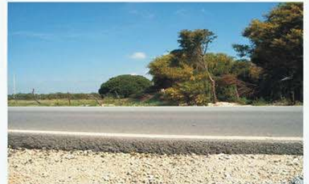
ZI- Perspectiva de la Zona de Influencia