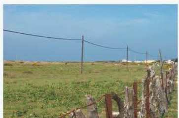
ZSP- Tendido eléctrico y uso ganadero