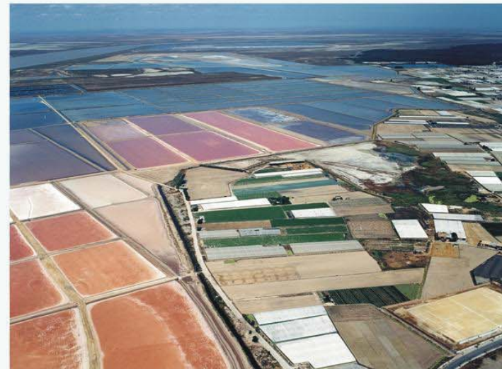
Fotografía oblicua del tramo en la que se aprecian las balsas de las salinas a la izquierda y los campos de cultivo e invernaderos ocupando la ZSP y la ZI con el Guadalquivir al fondo