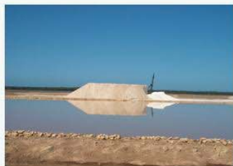
DPMT- Detalle de cristalizador