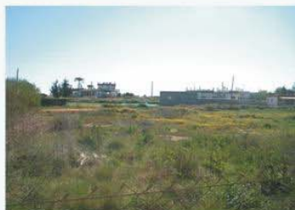
Erial en la ZSP con usos residenciales en la ZI