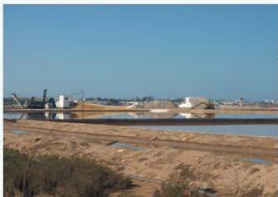
DPMT- Instalaciones de una salina industrial