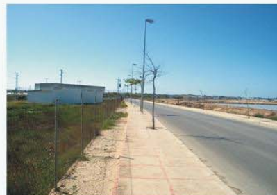
ZST- Carretera paralela al DPMT