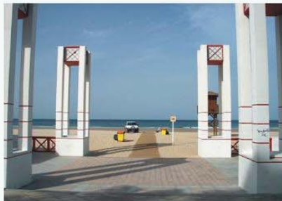
ZSP: Acceso al DPMT