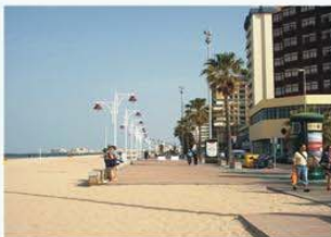
Panorámica del DPMT y la ZSP