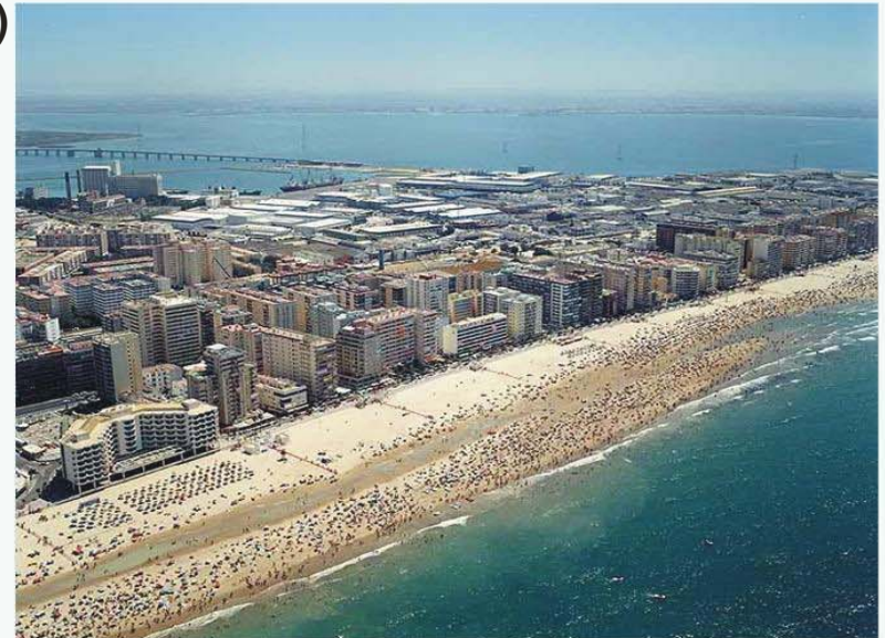
Fotografía oblicua del tramo en la que se aprecia la Playa de Victoria ocupada por los bañistas en los meses estivales, el paseo marítimo, y la fachada litoral completamente urbanizada