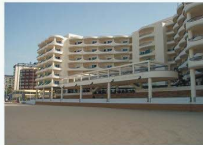
Perspectiva visual de la ZSP desde el DPMT