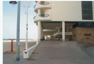
ZST: Paseo marítimo, y duchas en el DPMT