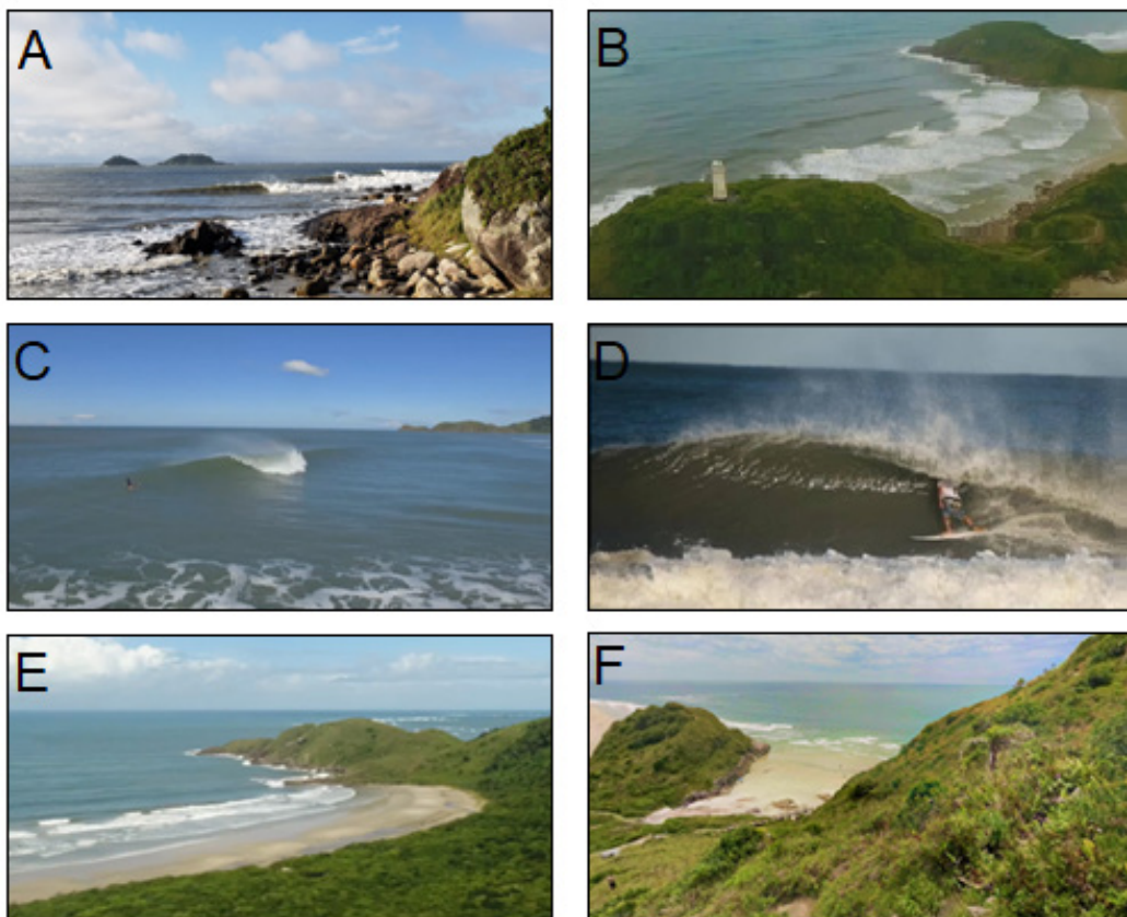
Figura 2. As principais praias para a prática de surfe na Ilha do Mel, litoral do Paraná. A = Paralelas; B = Praia de Fora; C = Praia Grande; D = Canto da Vó Maria; E = Praia do Miguel; e F = Mar de Fora e Praia da Gruta.

Figure 2. The main beaches for surfing on Ilha do Mel, coast of Paraná. A = Paralelas; B = Praia de Fora;